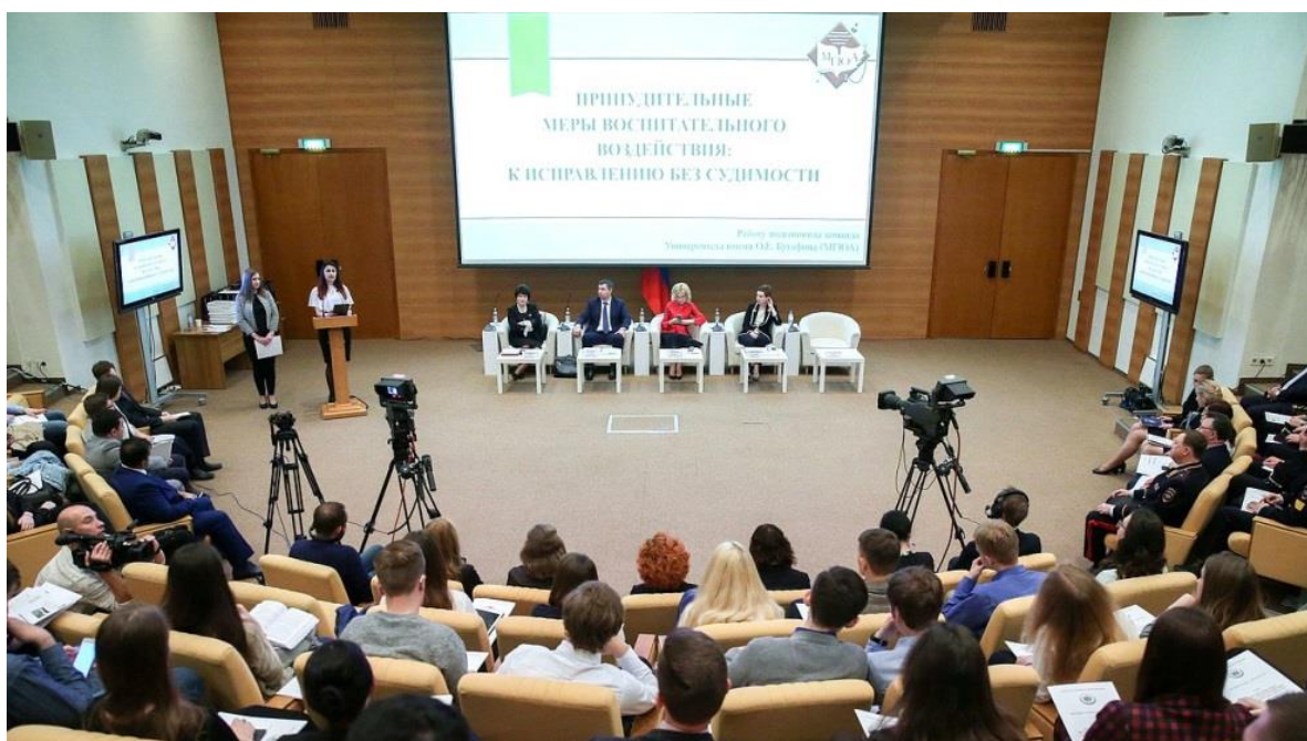
Финал конкурса творческих работ "Принудительные меры воспитательного воздействия: к исправлению без судимости"

финал конкурса творческих работ "Принудительные меры воспитательного воздействия: к исправлению без судимости" (г. Москва, Малый зал Государственной Думы, 6 июля 2018 года);