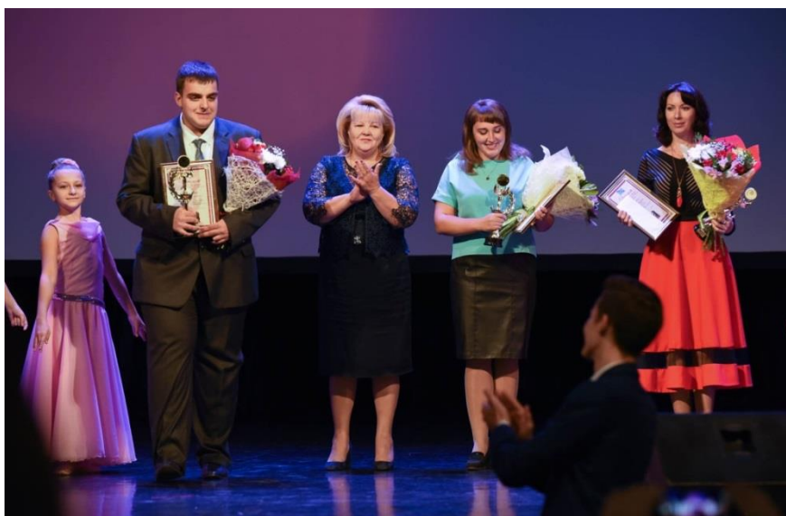
Вручение педагогической премии "Признание" в номинации "Дебют. Новые педагогические дарования"

торжественные церемонии в честь Дня учителя, посещение общеобразовательной школы Поныровского района, школы искусств Дмитриевского района Курской области (Курская область, 8 октября 2018 года);