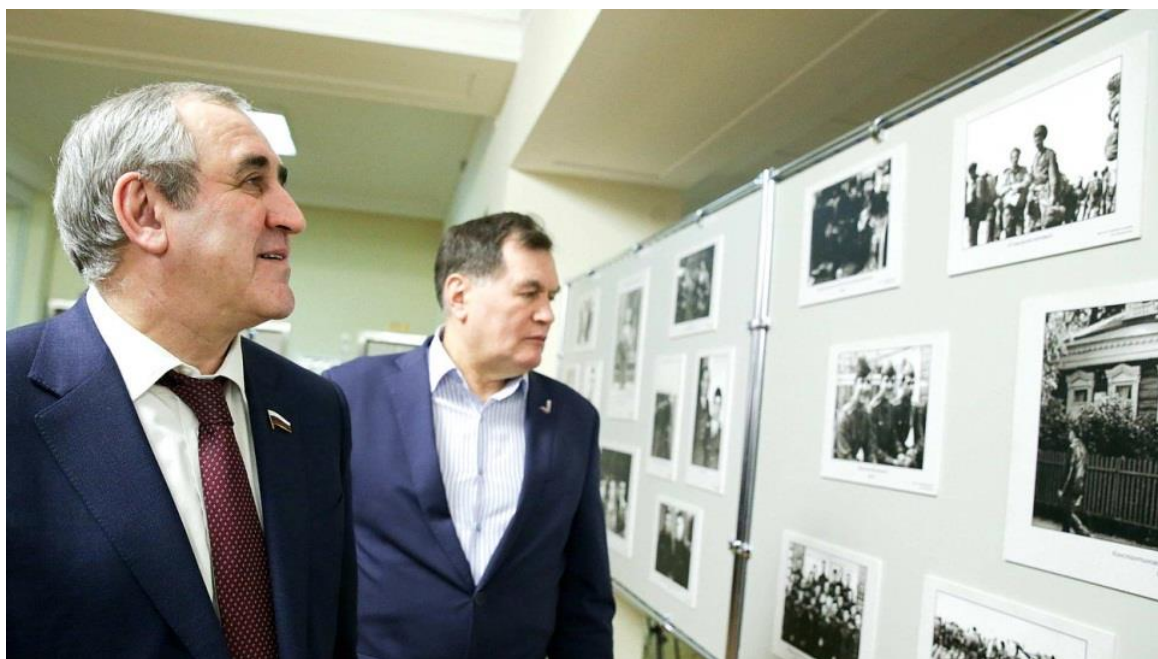
Открытие выставки На фото слева: заместитель Председателя Государственной Думы член Комитета С.И.Неверов

открытие выставки, посвященной 65-летию Героя Советского Союза Валерия Востротина (г. Москва, Государственная Дума, 7 февраля 2018 года);