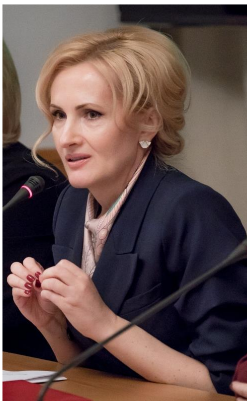
Расширенное заседание Комитета в зале 830 Государственной Думы (заместитель Председателя Государственной Думы И.А.Яровая)