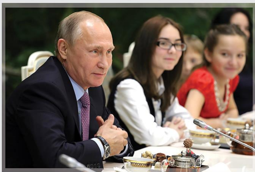
Встреча у Президента проходила за большим столом в неформальной обстановке. Во время чаепития семьи-победители успели не только рассказать о себе, но и обсудить самые серьезные проблемы: возможности использования материнского капитала, субсидий по ипотеке для семей с детьми, развития регионов и т.д.