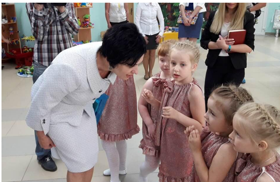
Городской фестиваль легоконструирования и робототехники "РоботоФест32"

городской фестиваль легоконструирования и робототехники "РоботоФест32" в детском саду "Лесная сказка" (г. Брянск, май 2018 года);