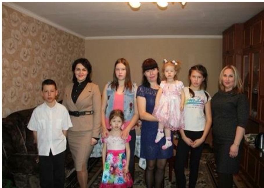
Встреча с многодетными семьями Городищенского муниципального района Волгоградской области

встреча с многодетными семьями Городищенского муниципального района Волгоградской области, поздравление с Международным женским днем (Городищенский район, 8 марта 2018 года);