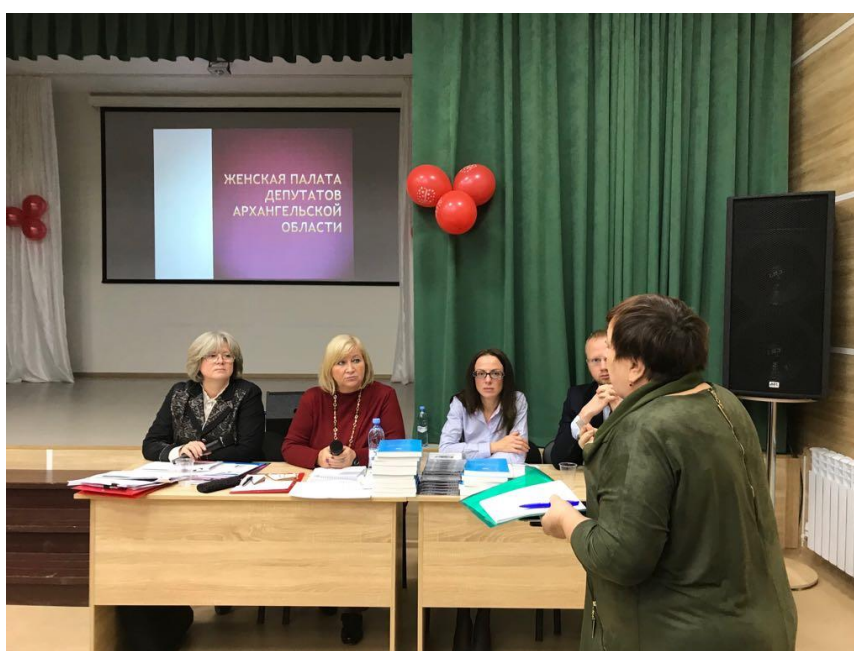
10-е заседание Женской палаты депутатов Архангельской области

10-е заседание Женской палаты депутатов Архангельской области – "Об основных параметрах бюджета Архангельской области и Муниципальных образований. Межбюджетные отношения. "Семейный" бюджет" (п. Богдановский, Устьянский район, Архангельская область, 2 ноября 2018 года);