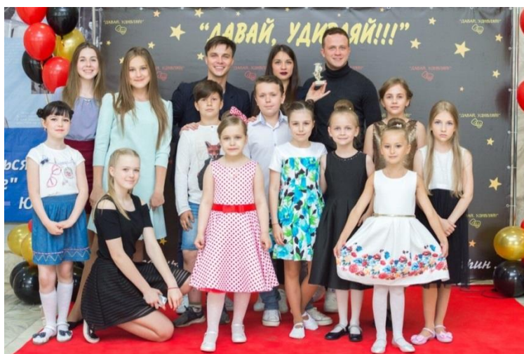
Фестиваль "Давай, удивляй!"

III ежегодный межрегиональный фестиваль мини-спектаклей "Давай, удивляй!" (г. Гагарин, Смоленская область, 28 мая 2018 года);