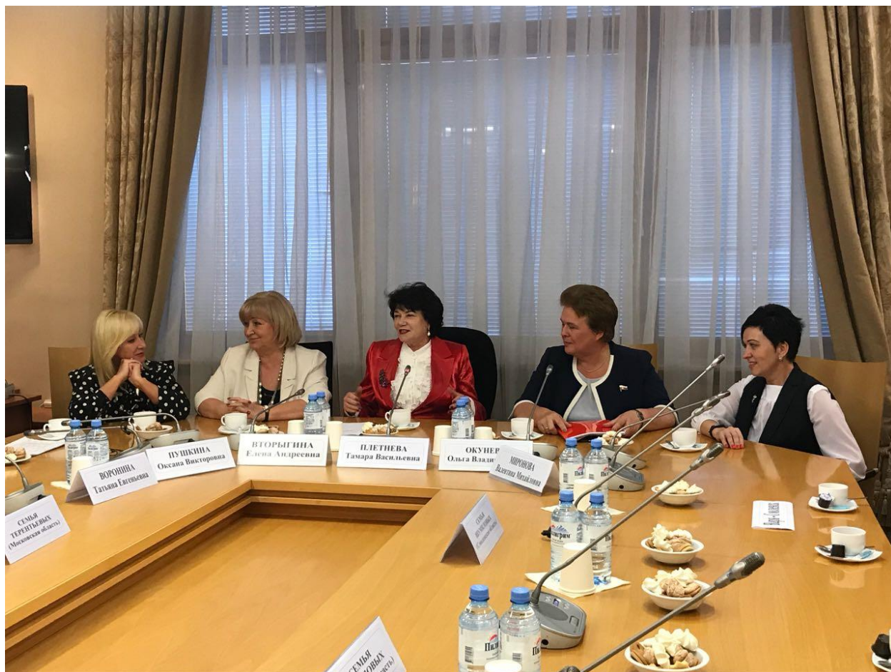
Встреча с победителями Всероссийского конкурса "Семья года – 2018"

21 ноября 2018 года состоялась встреча депутатов Комитета с победителями Всероссийского конкурса "Семья года – 2018" из Брянской, Тамбовской, Смоленской, Кировской и Московской областей.