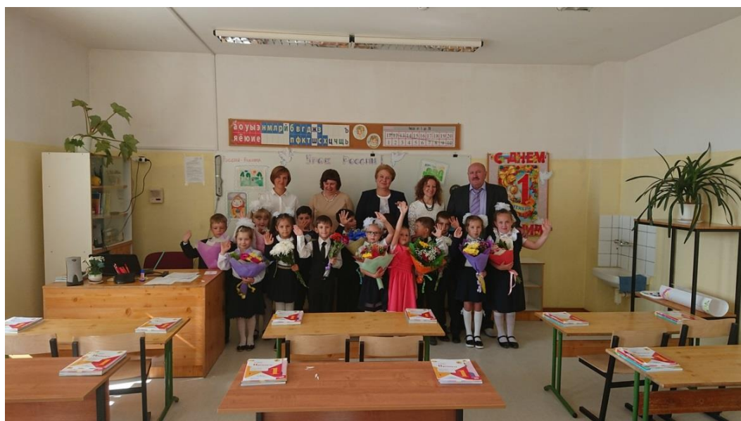
Торжественная линейка в школе № 3

торжественная линейка в школе № 3, митинг, посвященный 75-летию освобождения города и района от немецко-фашистских захватчиков (г. Ельня, Ельнинский район, Смоленская область, 3 сентября 2018 года)