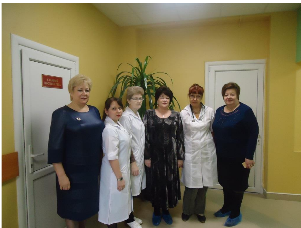
Встреча с работниками Тамбовского областного специализированного дома ребенка

встреча с работниками Тамбовского областного специализированного дома ребенка (г. Тамбов, 1 февраля 2018 года);