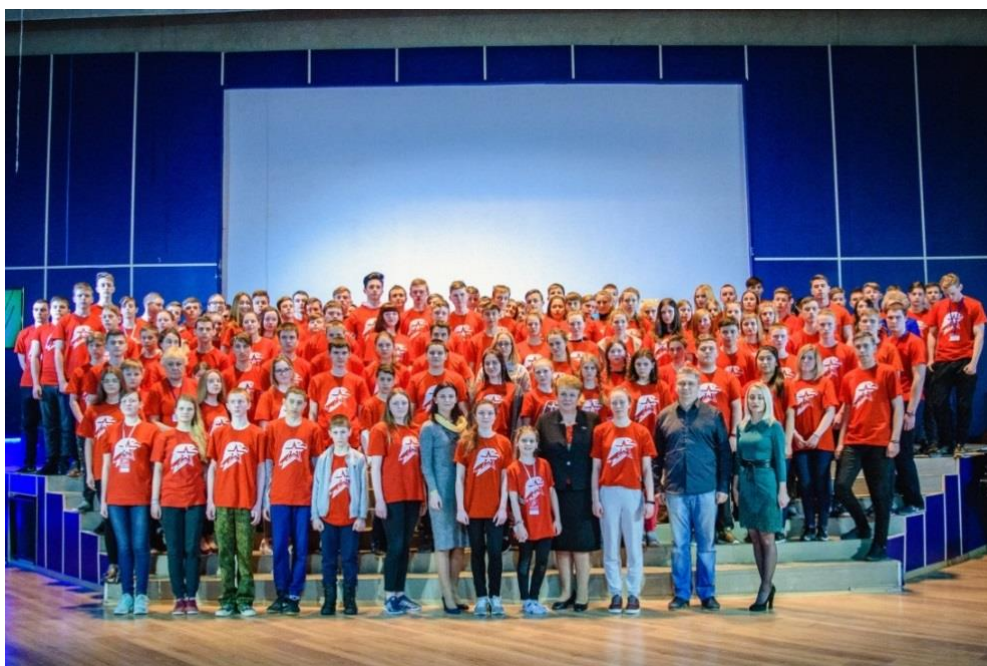
Встреча с юнармейцами Смоленщины

встреча с юнармейцами Смоленщины второй профильной юнармейской смены на базе санатория Н.М.Пржевальского (Смоленская область, 2 апреля 2018 года);