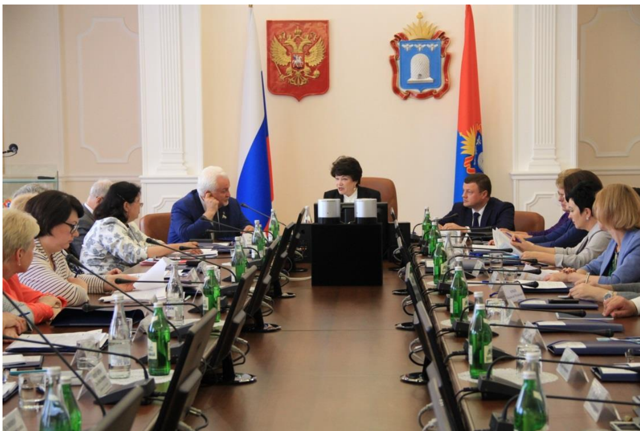
Выездное заседание "круглого стола" в г. Тамбове

В соответствии с Планом мероприятий по взаимодействию Государственной Думы Федерального Собрания Российской Федерации с законодательными (представительными) органами государственной власти субъектов Российской Федерации на 2018 год в период с 19 по 21 июня 2018 года в г. Тамбове проведен "круглый стол" на тему "Профилактика социального сиротства" с целью изучения успешного регионального опыта в данной сфере.