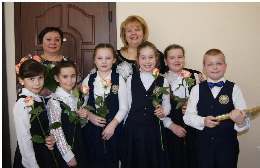
Победители конкурса – учащиеся 2 "В" класса, занявшие первое место с проектом "Легко ли быть депутатом?"

конкурс детских исследовательских проектов школы № 18 (20 апреля 2018 года);