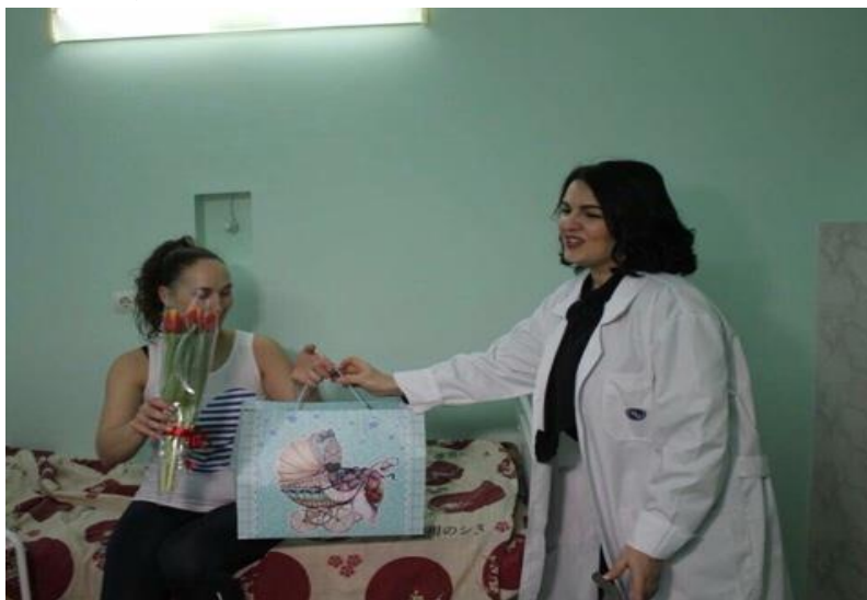
Встреча с молодыми мамами в рамках праздничной акции "Спасибо маме", родильный дом

встреча с молодыми мамами в рамках праздничной акции "Спасибо маме" – проект "Народный контроль" и "Крепкая семья" (г. Волгоград, родильный дом, 9 марта 2018 года);