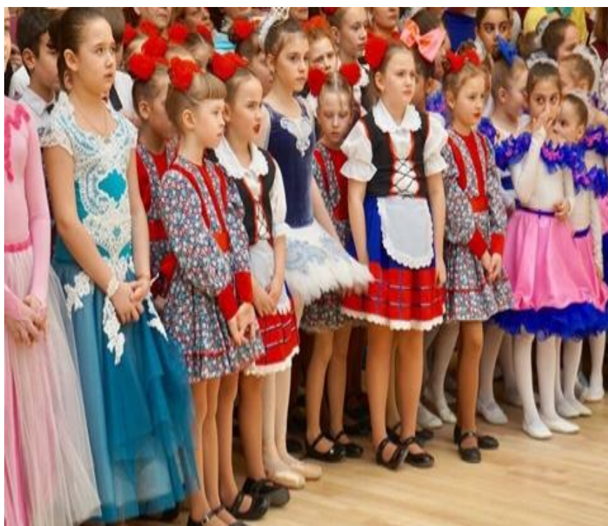
Торжественная церемония открытия Детского юношеского центра Волгограда

встреча с активом женских советов Октябрьского и Ломоносовского округов города Архангельска (6 марта 2018 года);