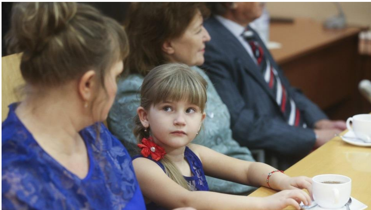
Встреча депутатов Комитета с победителями Всероссийского конкурса "Семья года – 2018"