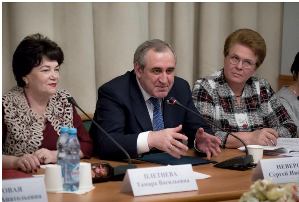
Расширенное заседание Комитета в зале 830 Государственной Думы На фото слева направо: председатель Комитета Т.В.Плетнева, заместитель Председателя Государственной Думы член Комитета С.И.Неверов, первый заместитель председателя Комитета О.В.Окунева

8 февраля 2018 года проведено расширенное заседание Комитета на тему "Школа – территория безопасности. Взаимодействие семьи и школы по профилактике правонарушений среди несовершеннолетних".