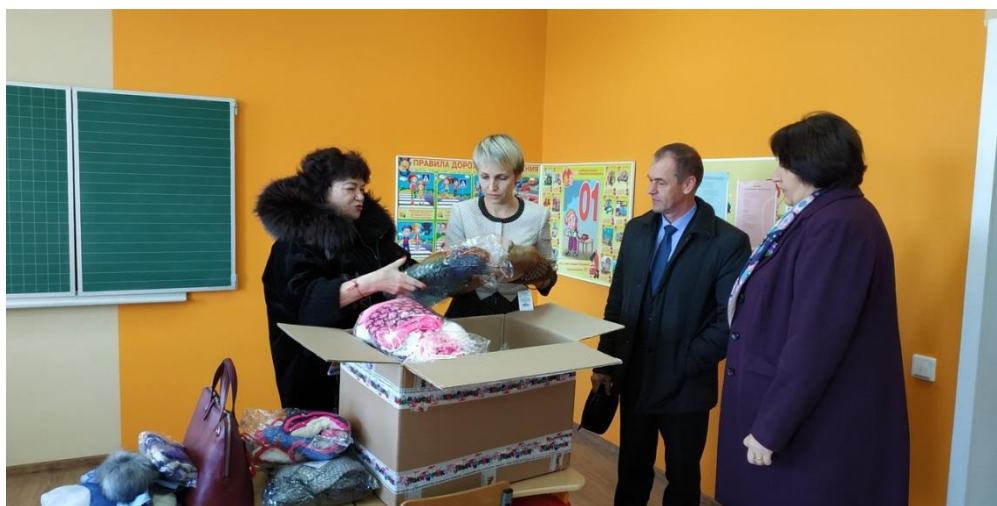
Дом творчества "Калейдоскоп"

посещение Дома творчества "Калейдоскоп" (п. Мучкап, Тамбовская область, 7 ноября 2018 года);