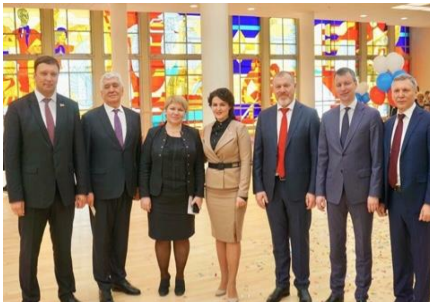
Торжественная церемония открытия Детского юношеского центра Волгограда

торжественная церемония открытия Детского юношеского центра Волгограда, встреча с будущими воспитанниками центра (г. Волгоград, Детский юношеский центр, 6 марта 2018 года);