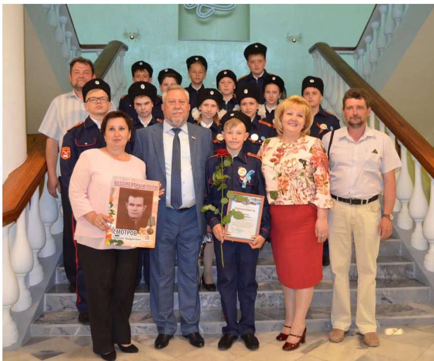
Награждение победителей кадетского проекта "Георгиевский сбор"

награждение победителей кадетского проекта "Георгиевский сбор" (г. Курск, 6 мая 2018 года);