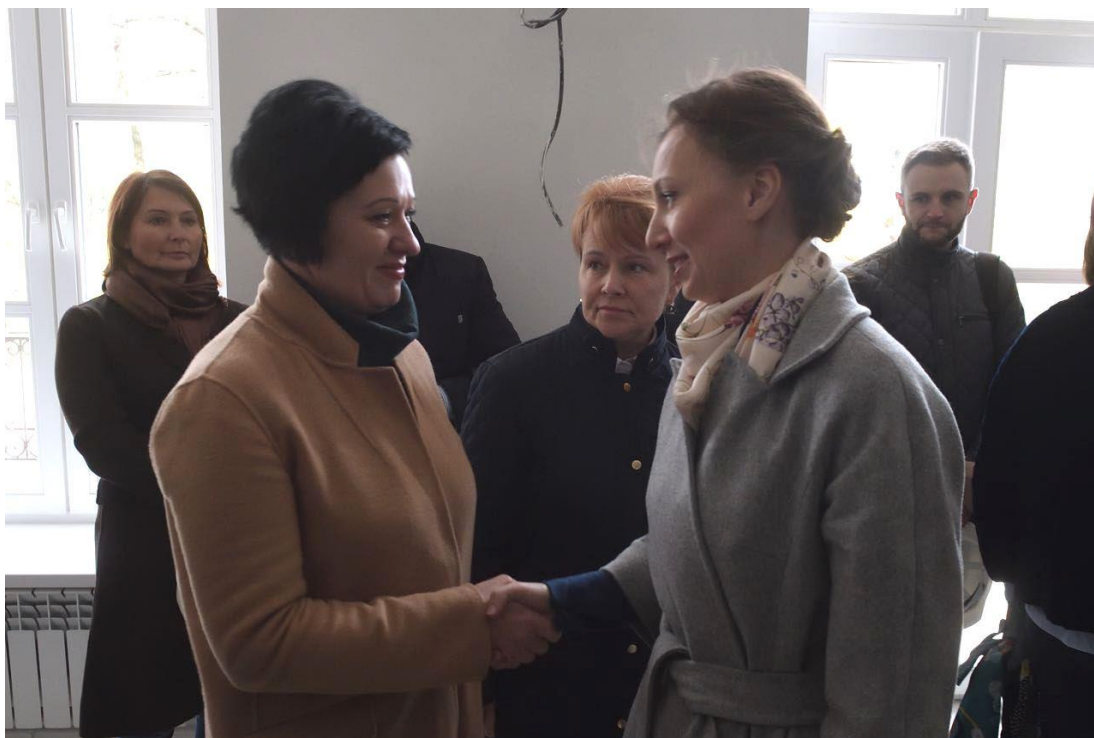
На фото слева направо: член Комитета В.М.Миронова, Уполномоченный при Президенте Российской Федерации по правам ребенка А.Ю.Кузнецова

финал конкурса творческих работ "Принудительные меры воспитательного воздействия: к исправлению без судимости" (г. Москва, Малый зал Государственной Думы, 6 июля 2018 года);