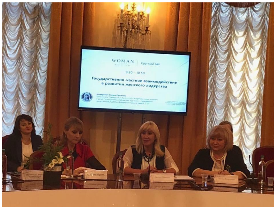
Форум "Женщина имеет значение" На фото слева направо: первый заместитель председателя Комитета Государственной Думы по международным делам С.С.Журова, заместители председателя Комитета О.В.Пушкина, Е.А.Вторыгина

Форум "Женщина имеет значение" (г. Москва, Колонный зал Дома Союзов, 16 ноября 2018 года);