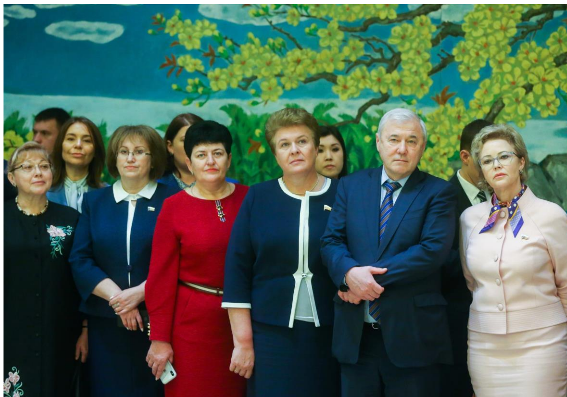
На фото третья справа: первый заместитель председателя Комитета О.В.Окунева