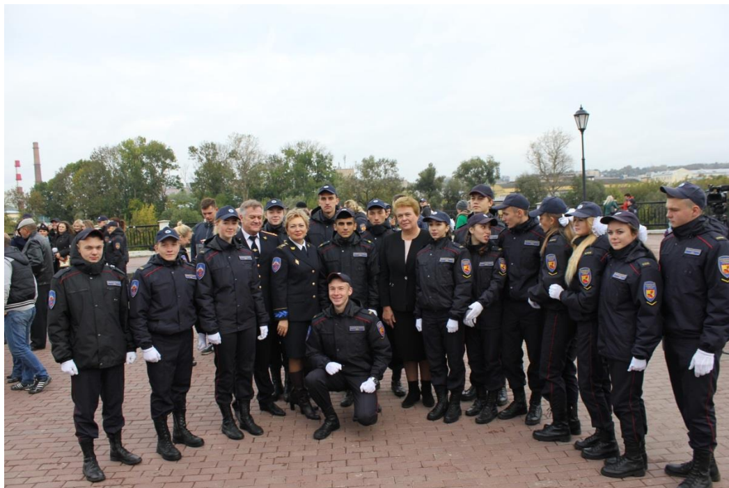
С участниками Смоленского юридического колледжа

торжественное мероприятие Смоленского юридического колледжа (церемониальная торжественная клятва) (Смоленская область, 8 октября 2018 года);