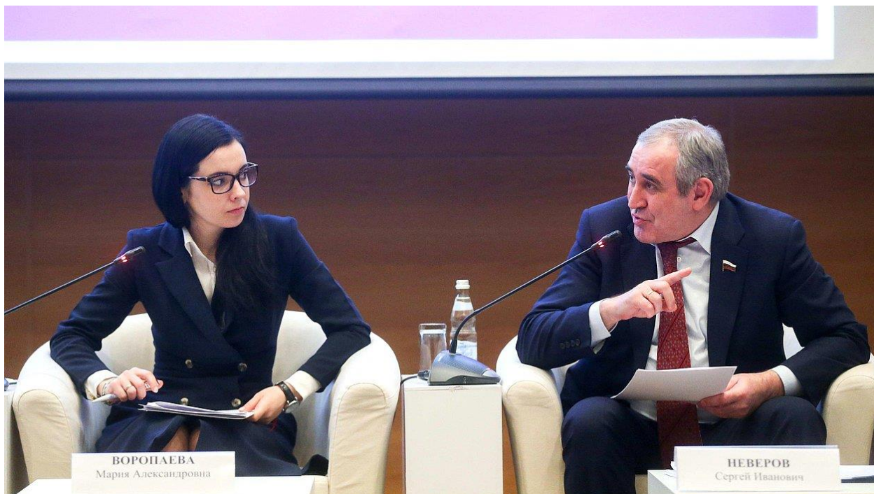
Заседание Молодежного парламента (председатель Молодежного парламента М.А.Воропаева, заместитель Председателя Государственной Думы член Комитета С.И.Неверов)

расширенное заседание коллегии Следственного комитета Российской Федерации (г. Москва, Следственный комитет Российской Федерации, 6 февраля 2018 года);