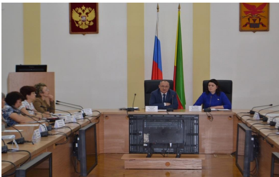
Совещание в Правительстве Забайкальского края

совещание в Правительстве Забайкальского края на тему "Либерализация уголовно-исполнительного кодекса в отношении осужденных", на котором состоялось обсуждение проекта федерального закона № 413710-7 "О внесении изменений в статью 66 Семейного кодекса Российской Федерации" и статью 15 Федерального закона "Об опеке и попечительстве" (Забайкальский край, 25 мая 2018 года);