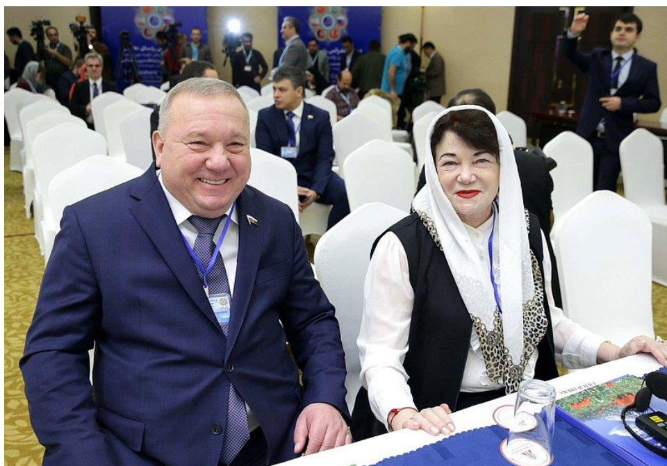
На фото: председатель Комитета по обороне В.А.Шаманов, председатель Комитета Т.В.Плетнева

официальный визит делегации Государственной Думы во главе с Председателем Государственной Думы В.В.Володиным в Иран (Исламская Республика Иран, г. Тегеран, 7 декабря 2018 года);