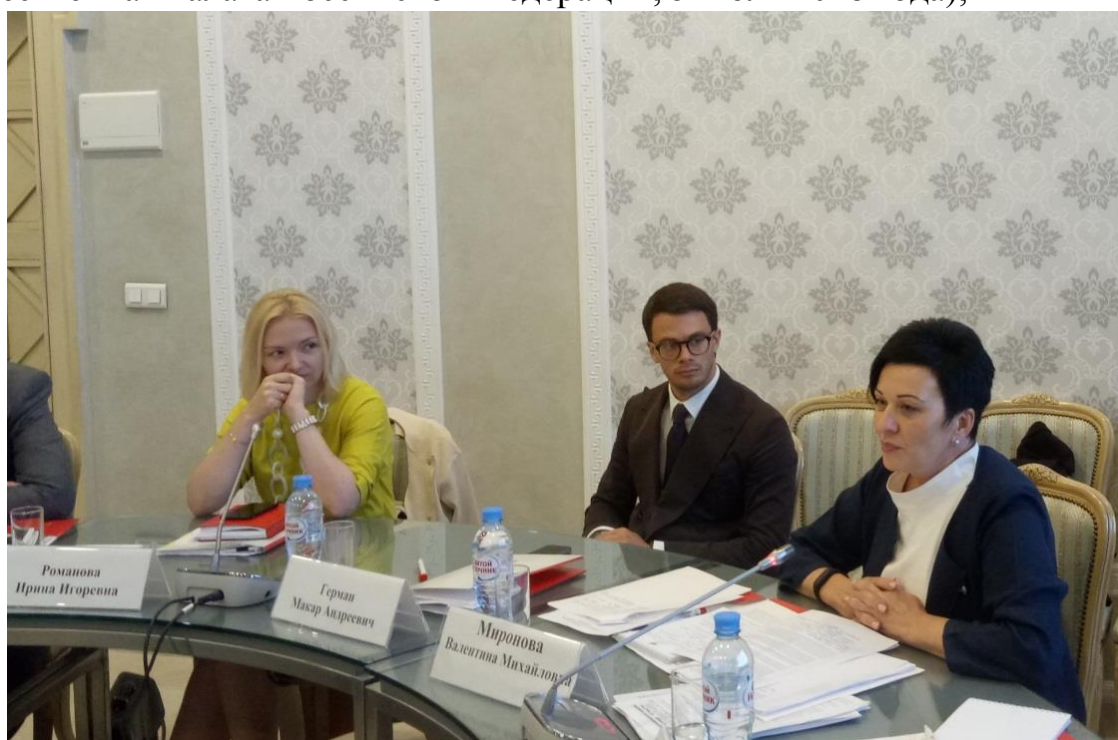
Заседание экспертной группы На фото справа: член Комитета В.М.Миронова

заседание Экспертной группы Проект-центра при Уполномоченном при Президенте Российской Федерации по правам ребенка (г. Москва, Общественная палата Российской Федерации, 5 июля 2018 года);