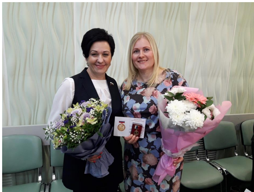
Торжественное вручение Почетного знака Брянской области "Материнская слава"

торжественное вручение Почетного знака Брянской области "Материнская слава" многодетным матерям, воспитавшим и воспитывающим 5 и более детей (Правительство Брянской области, Хрустальный зал, 23 ноября 2018 года);