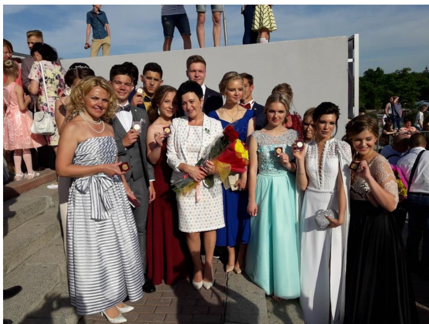
Торжественная церемония вручения медалей выпускникам школ города Брянска

торжественная церемония вручения медалей за особые успехи в учебе лучшим выпускникам школ города Брянска (Брянская область, 27 июля 2018 года) и др.;