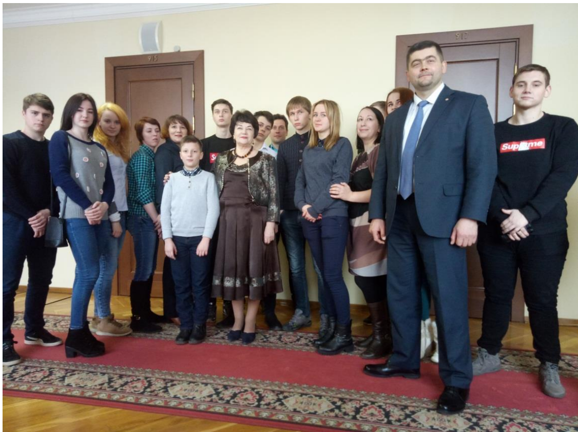
Встреча с учащимися ГБПОУ "Бологовский колледж" Тверской области с председателем Комитета Т.В.Плетневой

встреча с учащимися ГБПОУ "Бологовский колледж" Тверской области (г. Москва, Государственная Дума, 15 февраля 2018 года);