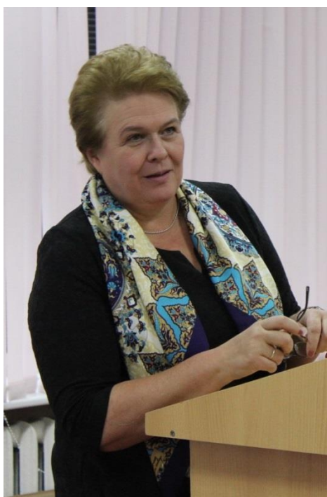
Первый заместитель председателя Комитета О.В.Окунева

посещение смоленского филиала Международного юридического института (г. Смоленск, 2 ноября 2018 года);