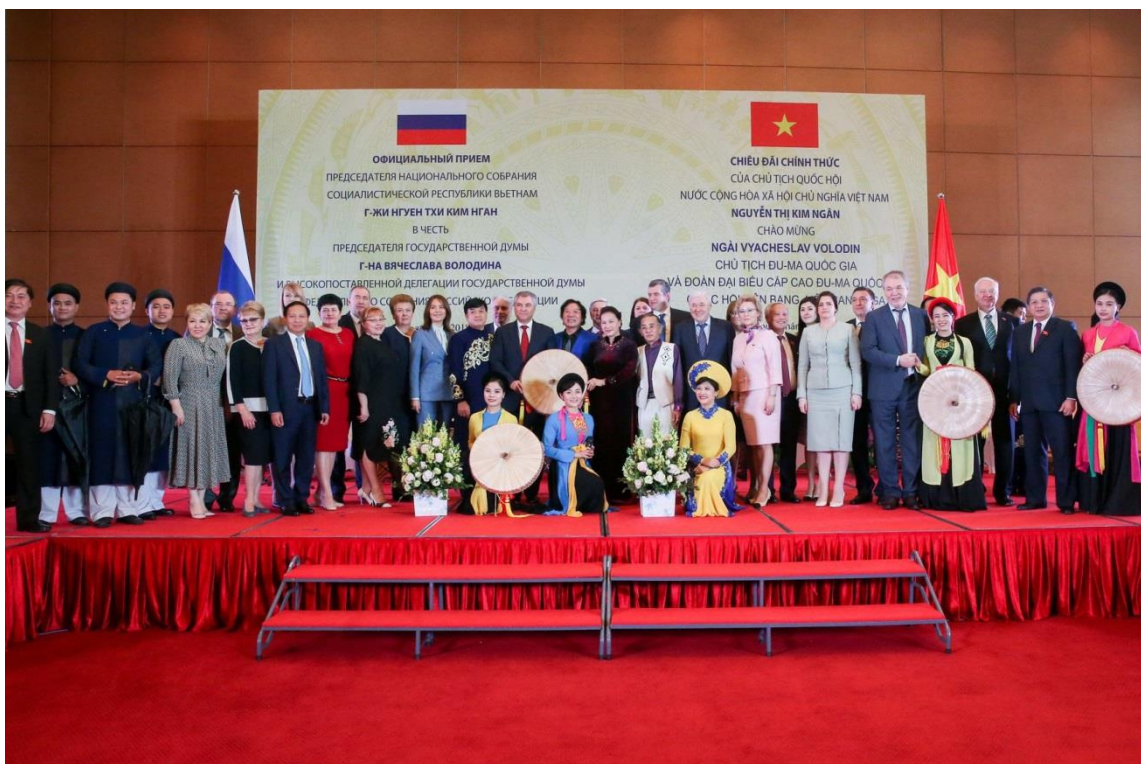
В зале заседания Национального собрания Социалистической Республики Вьетнам

официальный визит Председателя Государственной Думы Федерального Собрания Российской Федерации В.В.Володина в Социалистическую Республику Вьетнам (г. Ханой, 22–25 декабря 2018 г. ).