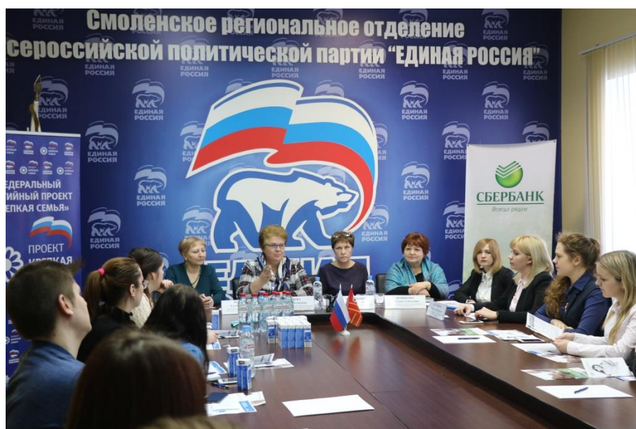
Встреча со студенческим активом смоленских вузов

встреча со студенческим активом смоленских вузов (Смоленская область, 1 марта 2018 года);