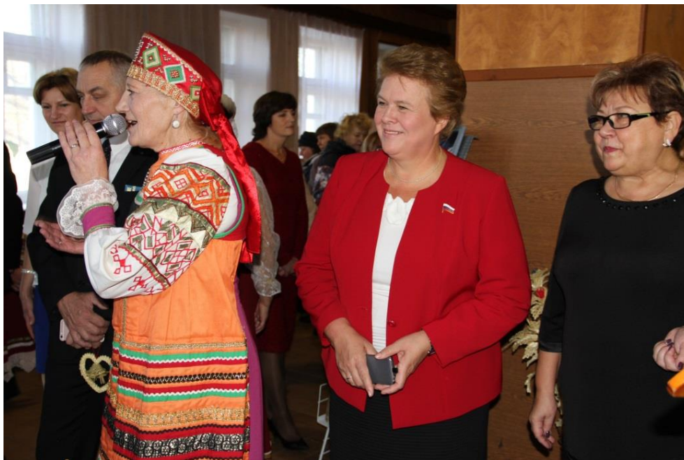
16-й российско-белорусский фестиваль народного творчества

16-й российско-белорусский фестиваль народного творчества "Две Руси – две сестры" (п. Хиславичи, Смоленская область, 6 ноября 2018 года);