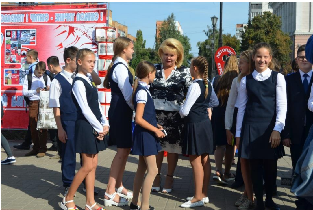
Выставка "Курск читающий"

выставка "Курск читающий" (г. Курск, 5 сентября 2018 года);