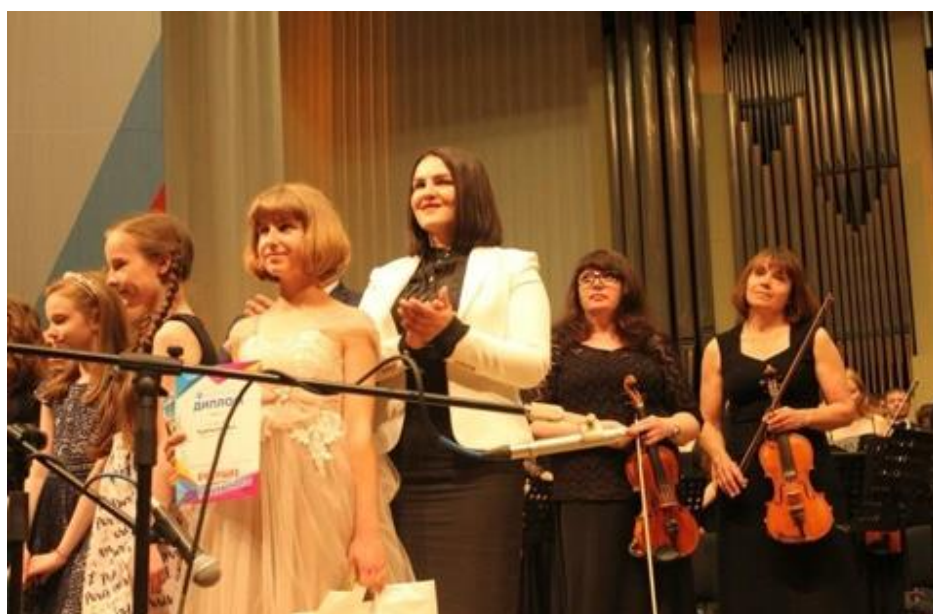
Встреча с лауреатами областного музыкального фестиваля детского и юношеского творчества

встреча с лауреатами областного музыкального фестиваля детского и юношеского творчества "Будущее начинается с прекрасного" (г. Волгоград, Центральный концертный зал, 2 июня 2018 года);