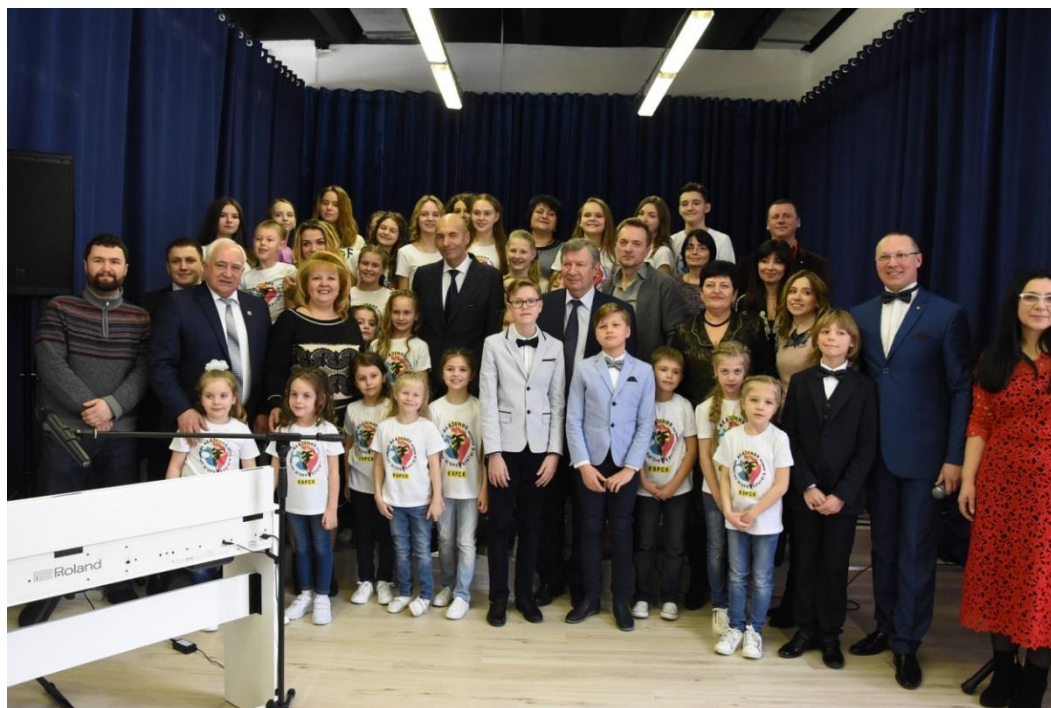
Открытие Академии популярной музыки

открытие Академии популярной музыки Игоря Крутого в Курске (13 марта 2018 года);