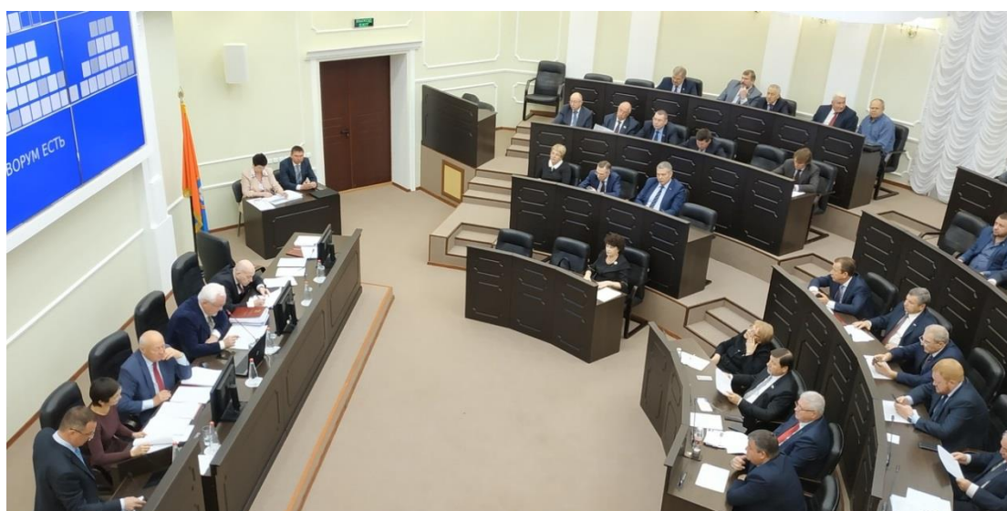
29-е заседание Тамбовской областной Думы шестого созыва

29-е заседание Тамбовской областной Думы шестого созыва (г. Тамбов, 7 ноября 2018 года);