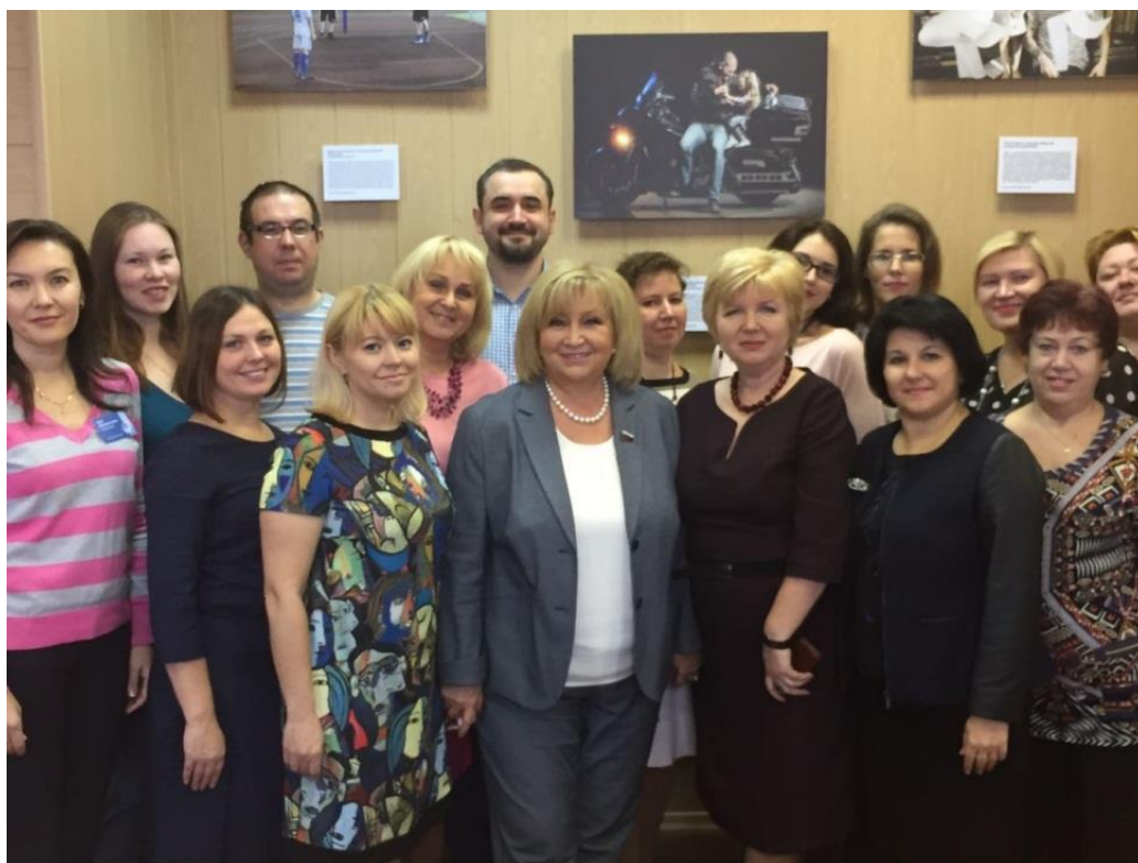
Областной семинар "Право ребенка жить в семье: что сделано и новые задачи"

областной семинар "Право ребенка жить в семье: что сделано и новые задачи" (Архангельская область, 29 июня 2018 года);