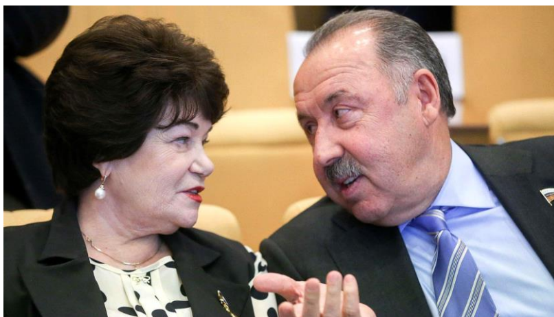
Председатель Комитета Т.В.Плетнева, заместитель председателя Комитета по физической культуре, спорту, туризму и делам молодежи В.Г.Газзаев

"Совершенствование законодательства в системе подготовки граждан к военной службе и военно-патриотического воспитания" (в деятельности ДОСААФ России) (г. Москва, Государственная Дума, 23 января 2018 года);