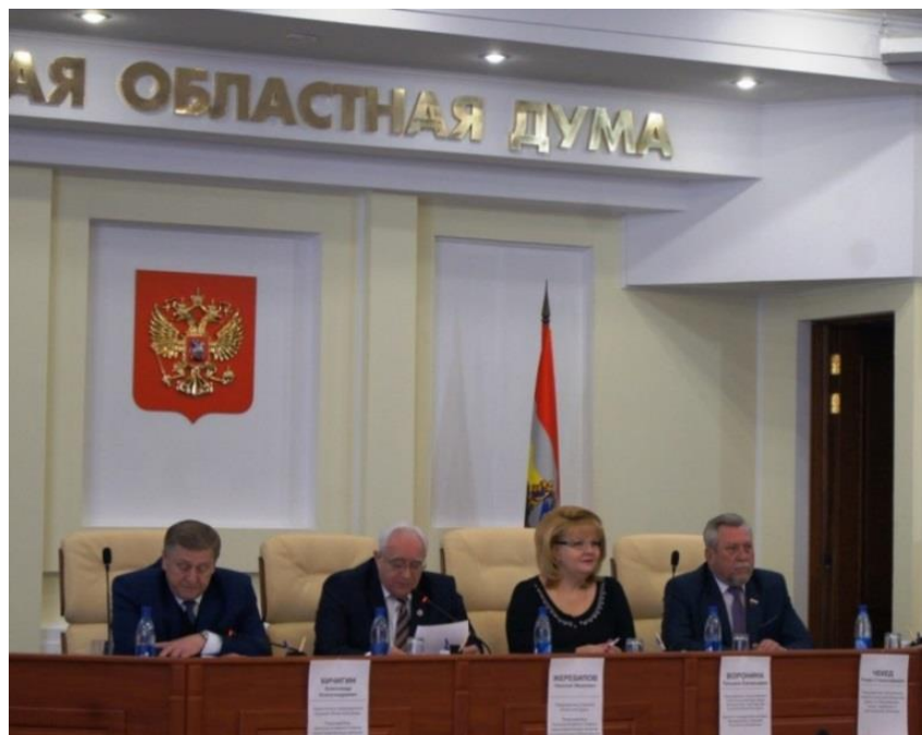
Совместное заседание, Курская областная Дума

встреча со студенческим активом смоленских вузов (Смоленская область, 1 марта 2018 года);