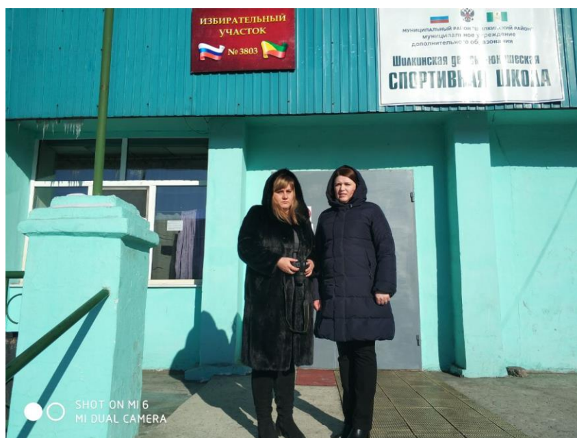
Встреча с учащимися Шилкинской детско-юношеской спортивной школы

встреча с учащимися Шилкинской детско-юношеской спортивной школы (Забайкальский край, 3 марта 2018 года);