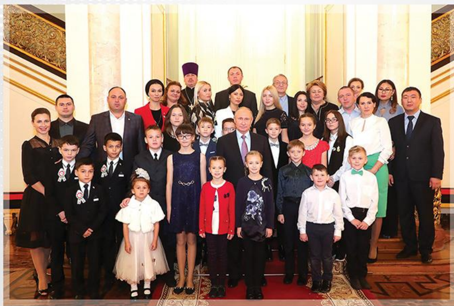
28 ноября 2017 года с семьями-победителями Всероссийского конкурса «Семья года» встретился Президент России Владимир Путин.