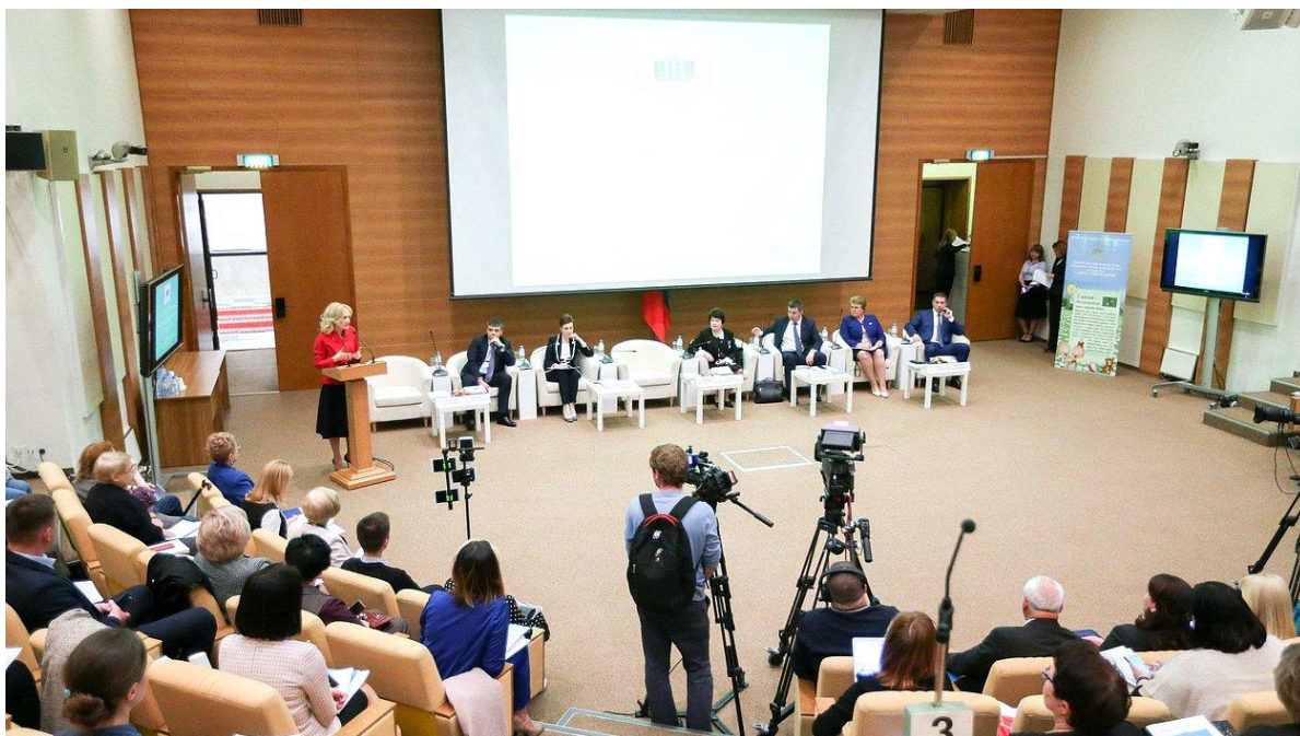
Парламентские слушания в Малом зале Государственной Думы

6 июня 2018 года состоялись парламентские слушания на тему "Десятилетие детства. Совершенствование государственной политики в сфере защиты детства".