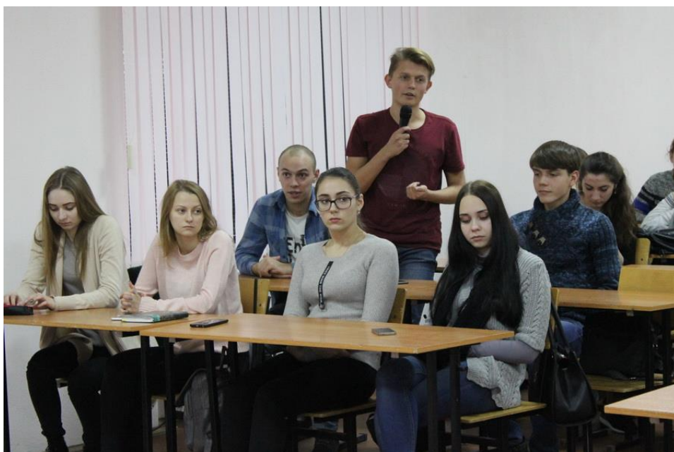
Посещение смоленского филиала Международного юридического института