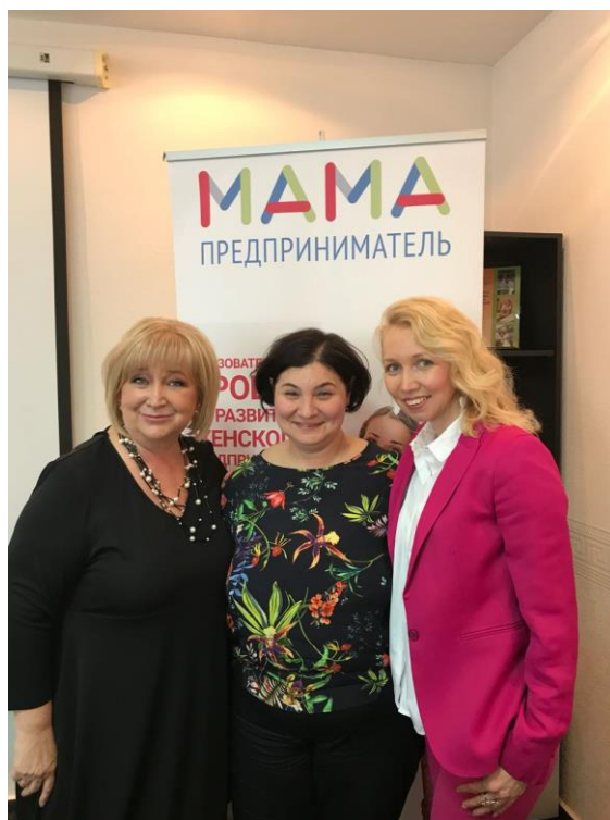
Заседание экспертного совета

заседание экспертного совета, подведение итогов и награждение победительницы федерального образовательного проекта "Мама предприниматель" в Архангельской области (25 мая 2018 года);