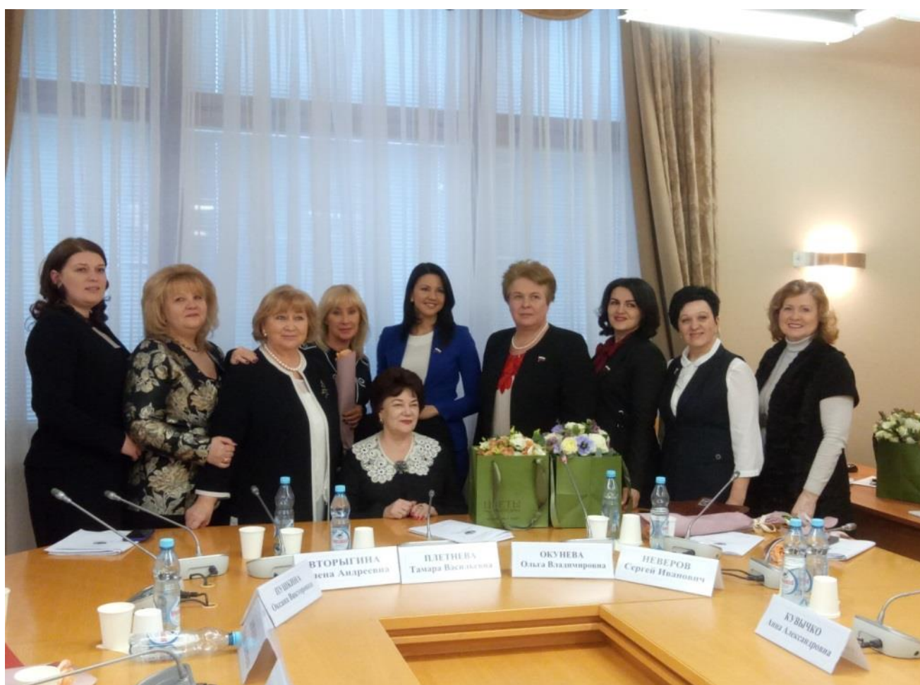
Комитет по вопросам семьи, женщин и детей