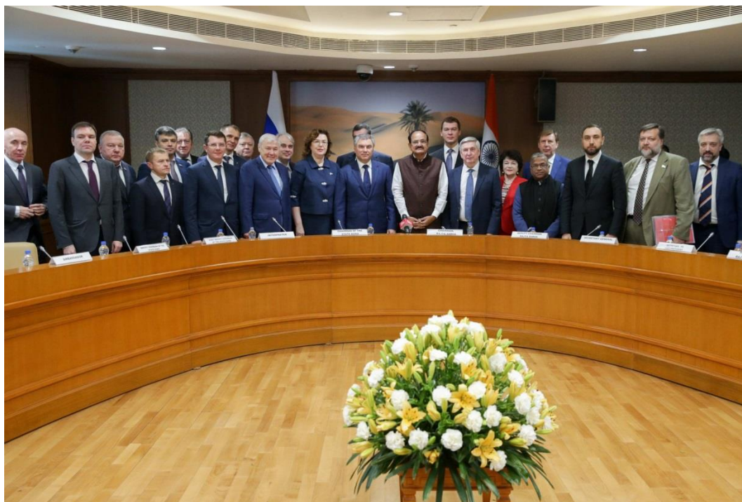
На фото в центре: Председатель Государственной Думы В.В.Володин и Вице-президент, Председатель Совета штатов Парламента Республики Индия Муппаварапу Венкайя Найдю

II Конференция спикеров парламентов Афганистана, Китая, Ирана, Пакистана, России и Турции по противодействию терроризму и укреплению регионального взаимодействия (Исламская Республика Иран, г. Тегеран, 7 декабря 2018 года);