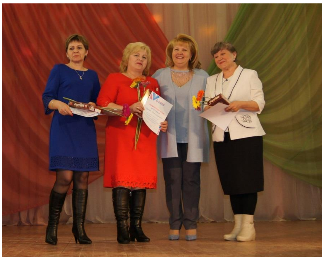
Форум сельских женщин

Форум сельских женщин (г. Курск, 16 марта 2018 года);