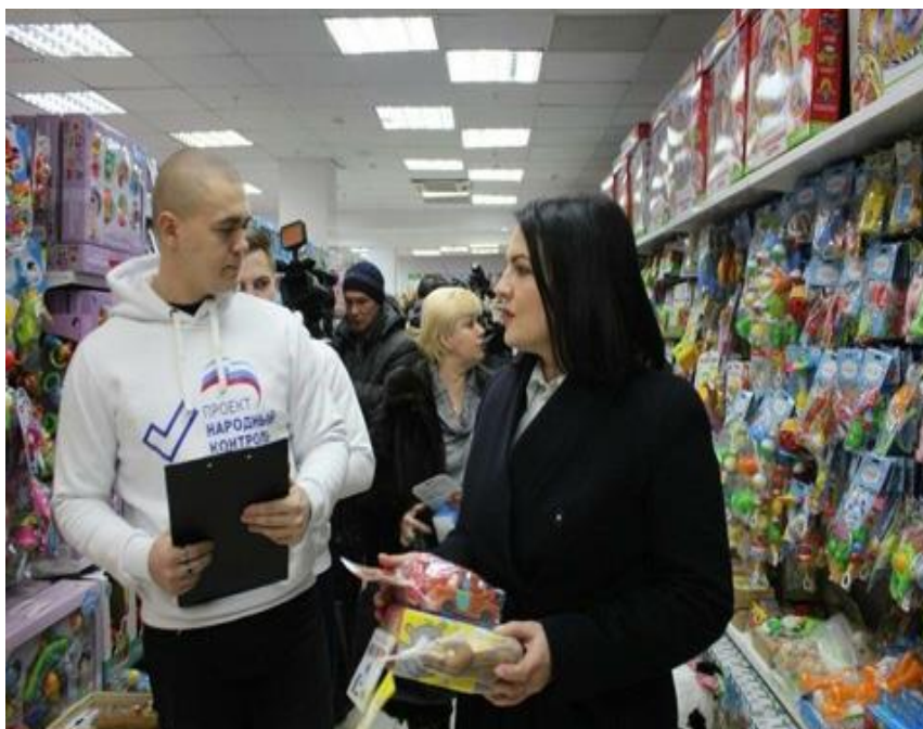
Проведение мониторинга некачественных товаров

проведение мониторинга некачественных товаров, предназначенных для детей, в рамках проекта "Территория детства" (г. Волгоград, 3 марта 2018 года);