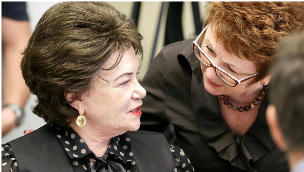
Расширенное заседание Комитета по контролю и Регламенту

расширенное заседание Комитета по контролю и Регламенту (г. Москва, Государственная Дума, 13 июня 2018 года);