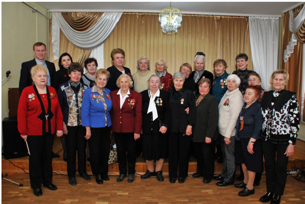
Вечер-чествование смолян – детей войны

вечер-чествование смолян – детей войны "Знаем мы о войне не из книжек" (Смоленская область, 27 апреля 2018 года);