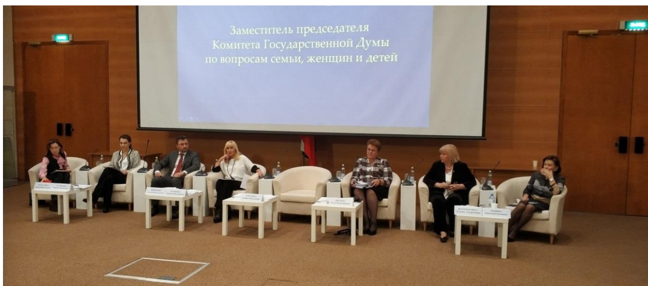
Заседание "круглого стола" в Малом зале Государственной Думы