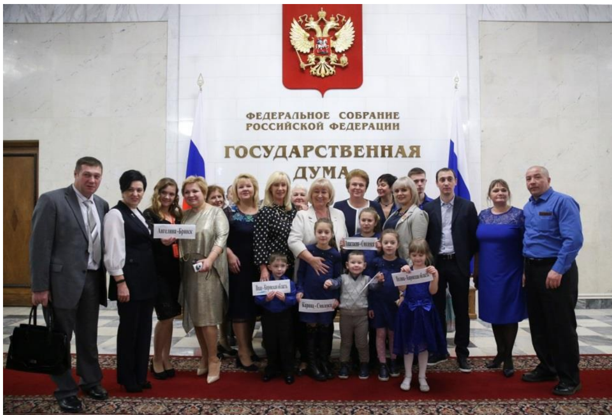
Члены Комитета с победителями конкурса