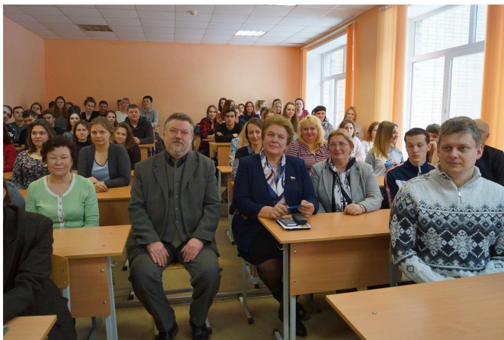
Встреча со студентами и преподавателями Смоленского филиала Российского экономического университета им. Г.В.Плеханова

встреча со студентами и преподавателями Смоленского филиала Российского экономического университета им. Г.В.Плеханова (г. Смоленск, 31 января 2018 года);