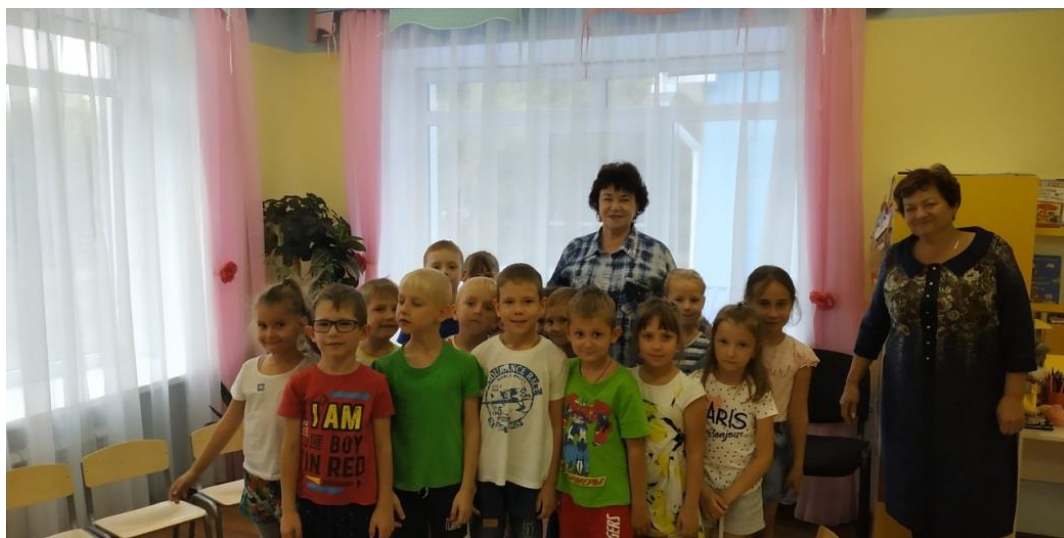
Встреча с воспитанниками детского сада "Жемчужинка"

встреча с воспитанниками детского сада "Жемчужинка" (Тамбовская область, 2 октября 2018 года);