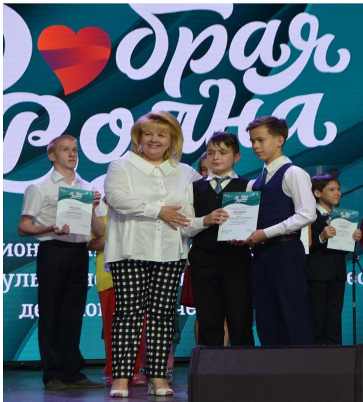
Отборочный этап Всероссийского благотворительного фестиваля детского творчества "Добрая волна"

отборочный этап Всероссийского благотворительного фестиваля детского творчества "Добрая волна" (г. Курск, 29 июня 2018 года);