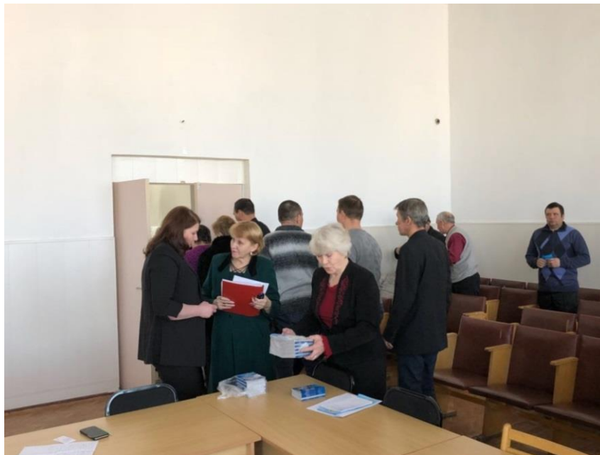
Встреча с членами Комиссии по делам несовершеннолетних и защите их прав Акшинского района

встреча с членами Комиссии по делам несовершеннолетних и защите их прав Акшинского района по вопросу профилактики и пресечения правонарушений среди несовершеннолетних в образовательных учреждениях (Забайкальский край, 30 января 2018 года);