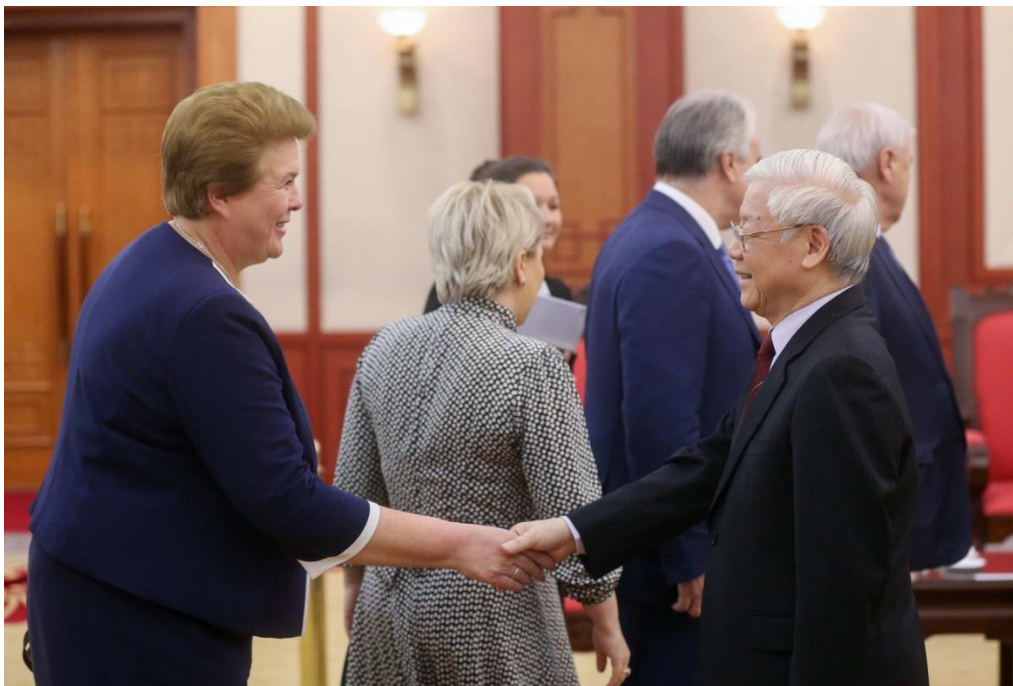
Первый заместитель председателя Комитета О.В.Окунева с Генеральным секретарем ЦК Коммунистической партии Вьетнама, Президентом Социалистической Республики Вьетнам Нгуен Фу Чонгом

"Профессия будущего: мифы и реальность" (Брянская область, Хрустальный зал Правительства Брянской области, март 2018 года);