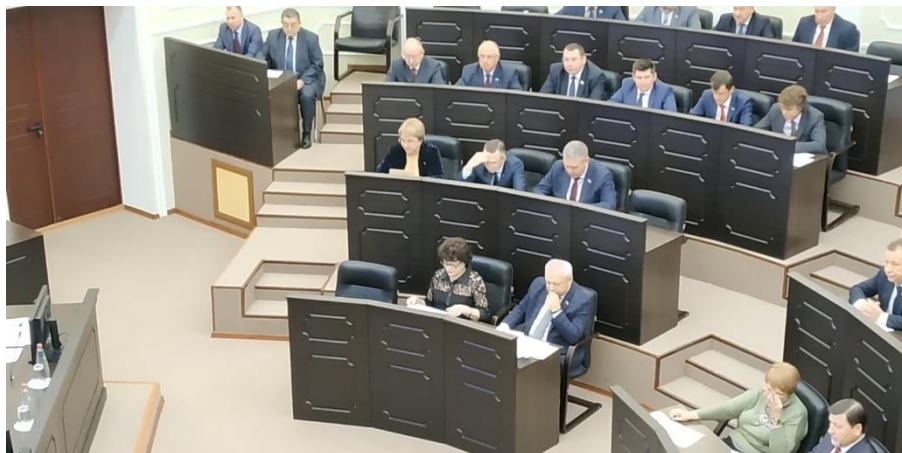
Заседание Тамбовской областной Думы

30-е заседание Тамбовской областной Думы шестого созыва (Тамбовская область, 30 ноября 2018 года);