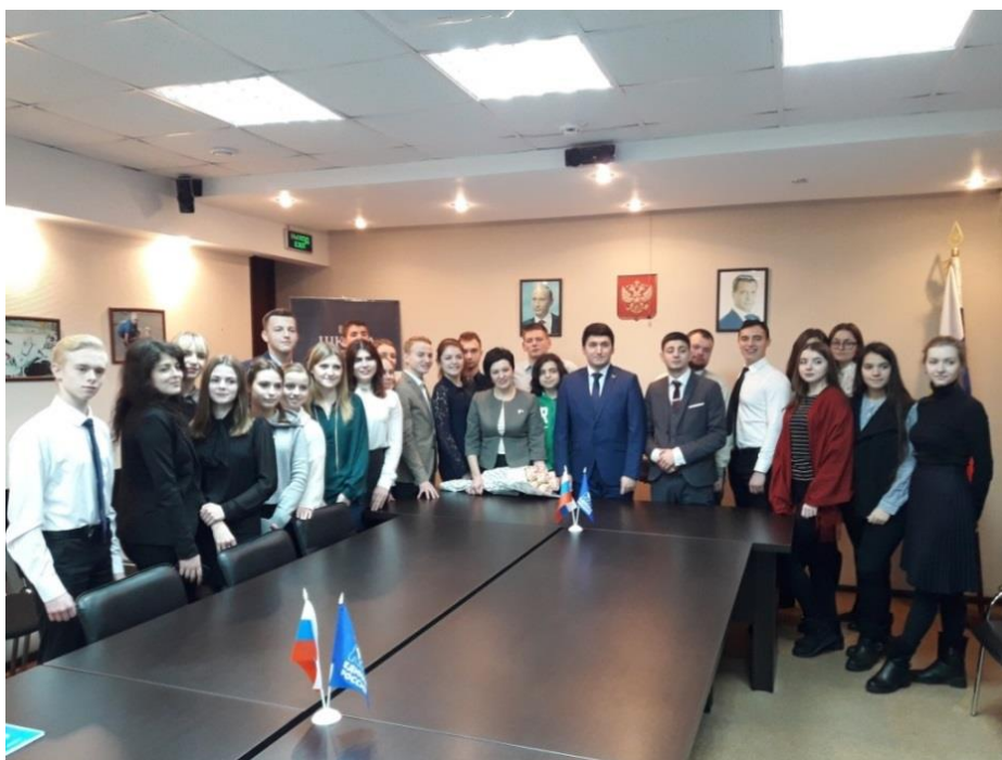
Встреча с участниками "Школы Парламентаризма"

встреча с участниками "Школы Парламентаризма" (Брянская область, 2 февраля 2018 года);