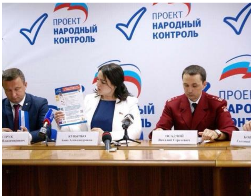
Пресс-конференция "Безопасная игрушка"

пресс-конференция "Безопасная игрушка" в рамках проекта "Народный контроль" – направление "Территория детства" (г. Волгоград, 1 июня 2018 года);