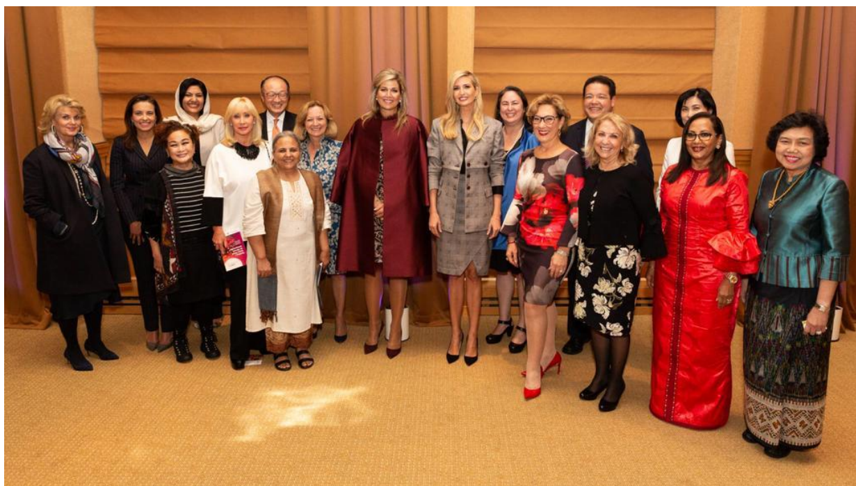
Встреча мировых лидеров We-Fi

встреча мировых лидеров We-Fi ("Финансовые инициативы женщин-предпринимателей") в рамках сессии Генеральной Ассамблеи ООН (г. Нью-Йорк, 25 сентября 2018 года);