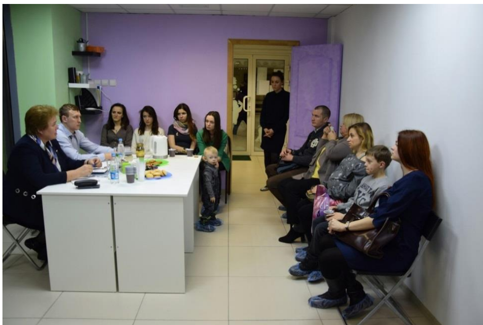
Встреча с коллективом и семьями, занимающимися в центре развития эмоционального интеллекта детей "Долина монсиков"

встреча с коллективом и семьями, занимающимися в центре развития эмоционального интеллекта детей "Долина монсиков" (г. Смоленск, ДС "Юбилейный", 30 января 2018 года);