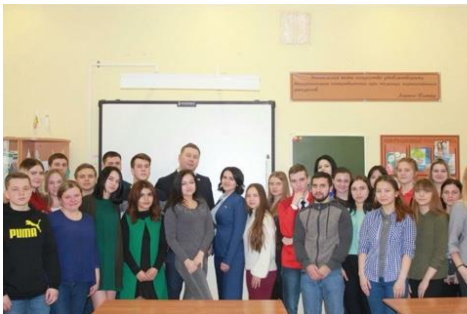
Встреча с учащимися Волгоградского экономико-технического колледжа Краснооктябрьского района города Волгограда

встреча с учащимися Волгоградского экономико-технического колледжа Краснооктябрьского района города Волгограда (16 марта 2018 года);