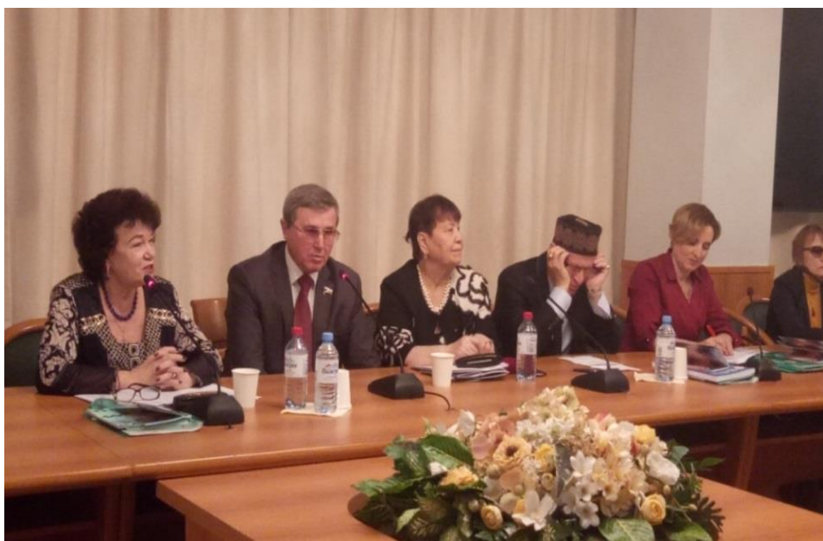
Заседание "круглого стола"

"Учитель – ученик – родитель: почему школа становится местом насилия?" (г. Москва, Государственная Дума, 8 октября 2018 года);