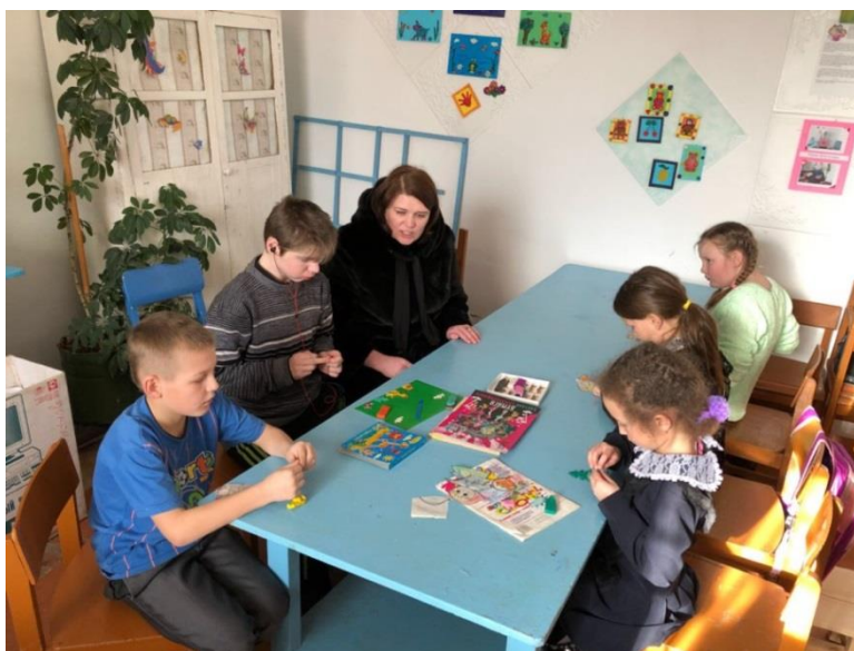
Посещение детско-юношеской спортивной школы с/п "Акшинское"

посещение детско-юношеской спортивной школы с/п "Акшинское" Акшинского района Забайкальского края (Забайкальский край, 30 января 2018 года);