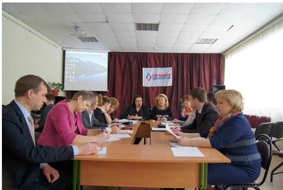
Заседание Совета молодых депутатов

заседание Совета молодых депутатов Курской области (г. Курск, 6 февраля 2018 года);