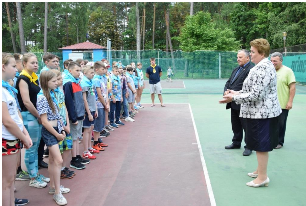
Открытие лагеря в музее-заповеднике "Бородинское поле" На фото справа: первый заместитель председателя Комитета О.В.Окунева

совещание КСФ "Духовно-нравственное и патриотическое воспитание молодежи как фактор развития гражданского общества" (г. Москва, Совет Федерации, 4 июля 2018 года);