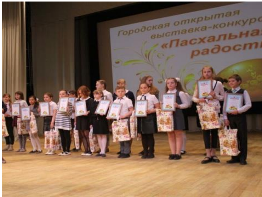
Открытие выставки-конкурса декоративно-прикладного творчества "Пасхальная радость – 2018"

открытие выставки-конкурса декоративно-прикладного творчества "Пасхальная радость – 2018", встреча с победителями конкурса (г. Волгоград, 20 апреля 2018 года);