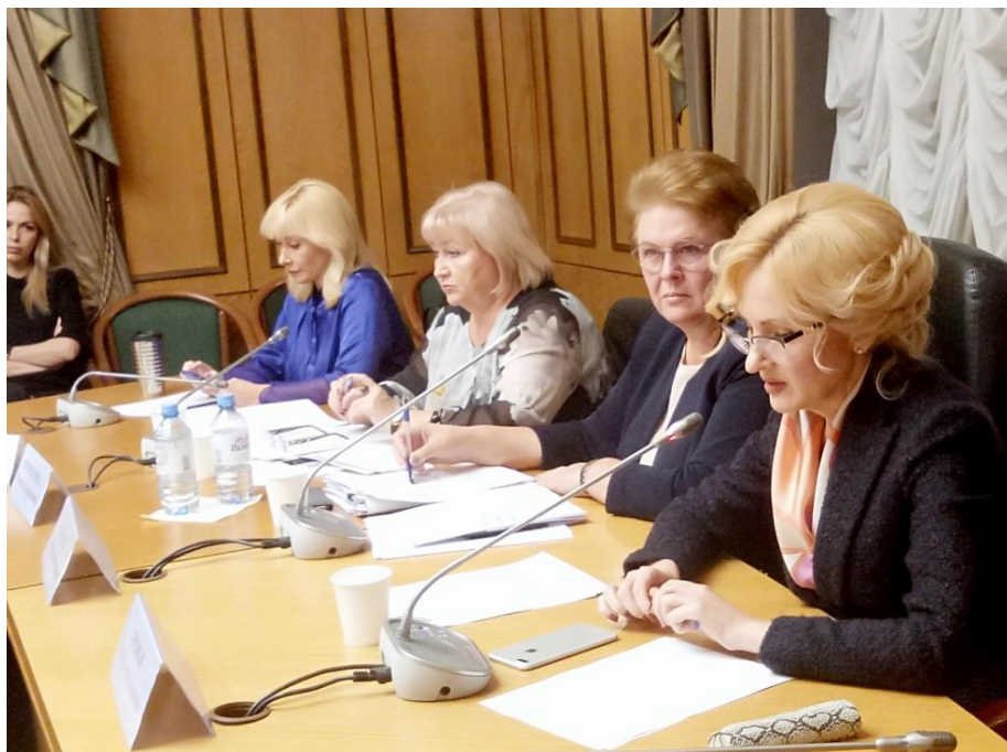
Специальное (расширенное) заседание Комитета в зале 304 Государственной Думы (Охотный ряд, д.1)

20 ноября 2018 года проведено специальное (расширенное) заседание Комитета на тему "О реализации законодательных и иных нормативных актов в сфере отдыха и оздоровления детей. Итоги летней оздоровительной кампании 2018 года".