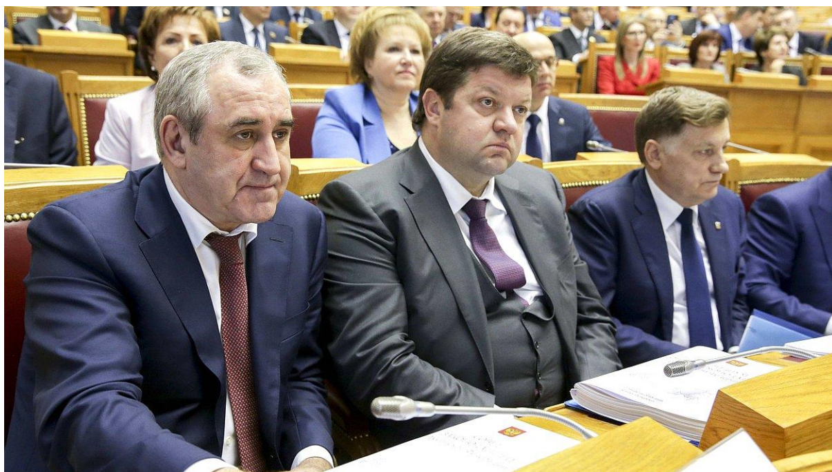
Заседание Президиума Совета законодателей Российской Федерации На фото слева: заместитель Председателя Государственной Думы член Комитета С.И.Неверов

заседание Президиума Совета законодателей Российской Федерации при Федеральном Собрании Российской Федерации, (г. Москва, Совет Федерации, 27 апрель 2018 года);