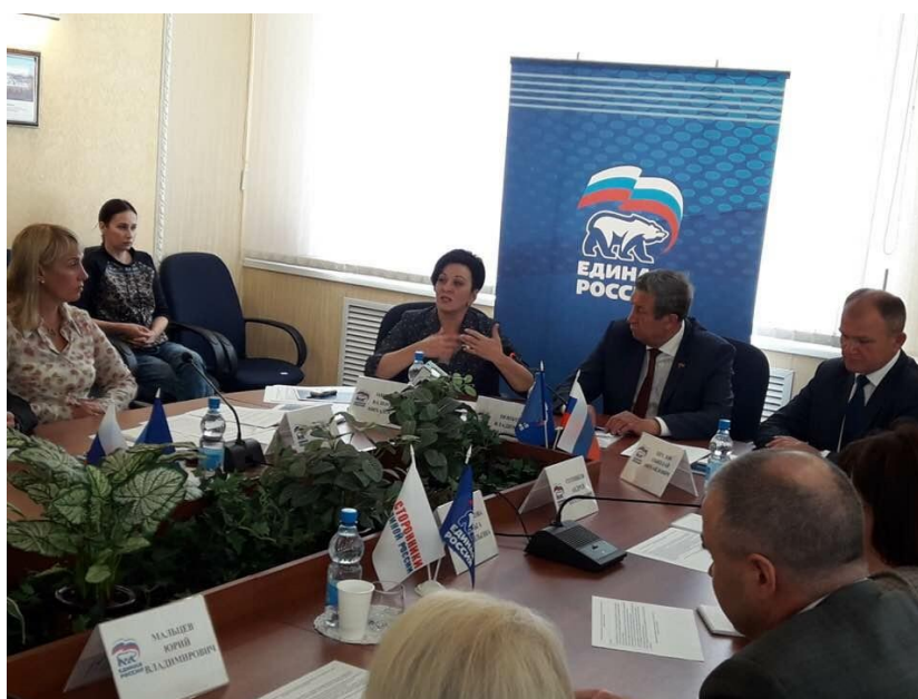
Заседание "круглого стола", Брянская область

"Безопасность детей, находящихся в детских учреждениях и летних оздоровительных лагерях" (Брянская область, июль 2018 года).